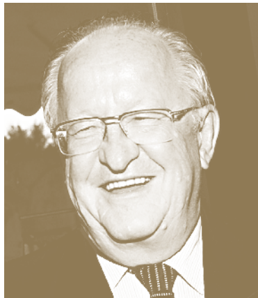
Виктор Владимирович Геращенко